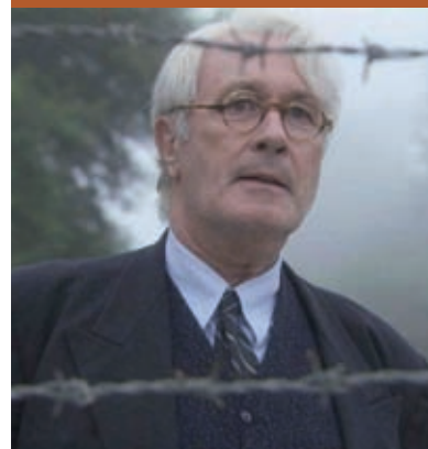
Désobéir , film de Joël Santoni.