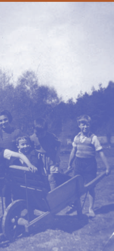
Groupe d'enfants réfugiés au Château de Chaumont

Synopsis : Le 7 juin 1942, premier jour du port obligatoire de l'étoile jaune pour les Juifs, des