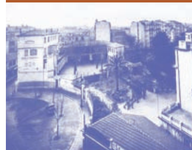
École Sasserno, pensionnat et externat de garçons, place Sasserno, Nice

CHACUNE DES PAGES DU SITE INTERNET PEUT ÊTRE IMPRIMÉE, POUR CRÉER DES SOURCES PÉDAGOGIQUES, COMPLÉTANT LES COURS D'HISTOIRE SUR LA SECONDE GUERRE MONDIALE ET D'ÉDUCATION CIVIQUE ET CITOYENNE, AVEC DES ILLUSTRATIONS TRÈS LOCALES.