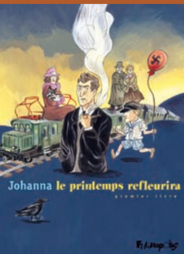
Le printemps refleurira, éditions Futuropolis