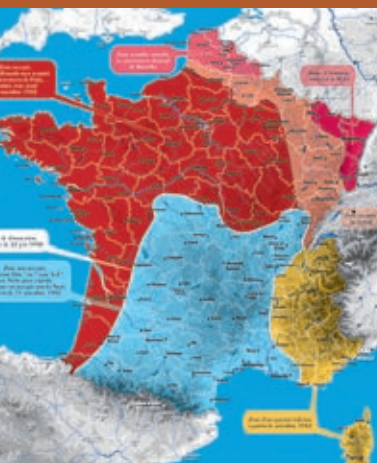
La France en 1942

Une page pour chacun des innombrables lieux de sauvetage en France (couvents, pensionnats, hôtels, abbayes, lycées, collèges...).